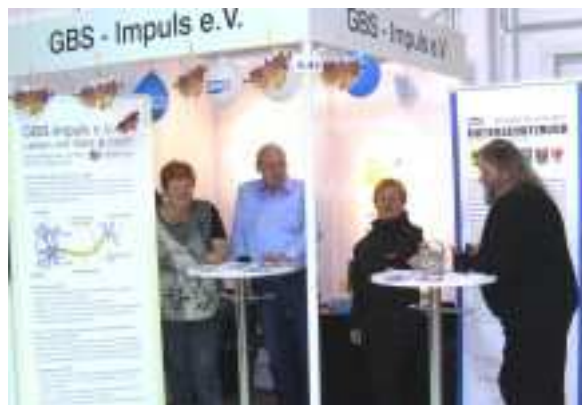
An unserem Messestand 2016

Wir werden gemeinsam mit dem DMB - Mieterschutzbund Eichwalde, Zeuthen und Umgebung e.V. einen Stand zum Thema „Behinderungen und barrierefreies Bauen und Wohnen“ gestalten.