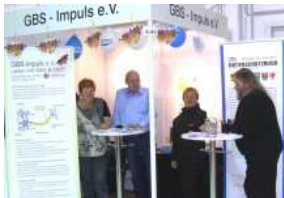
An unserem Messestand 2016

Wir werden gemeinsam mit dem DMB - Mieterschutzbund Eichwalde, Zeuthen und Umgebung e.V. einen Stand zum Thema „Behinderungen und barrierefreies Bauen und Wohnen“ gestalten.